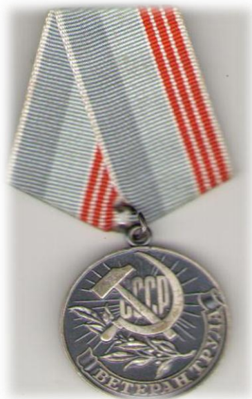
Фото 2. Медаль «Ветерану труда».