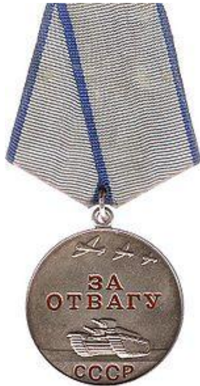
Фото 1. Медаль «За отвагу»