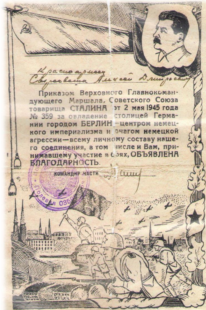
Документ 5. Благодарность.