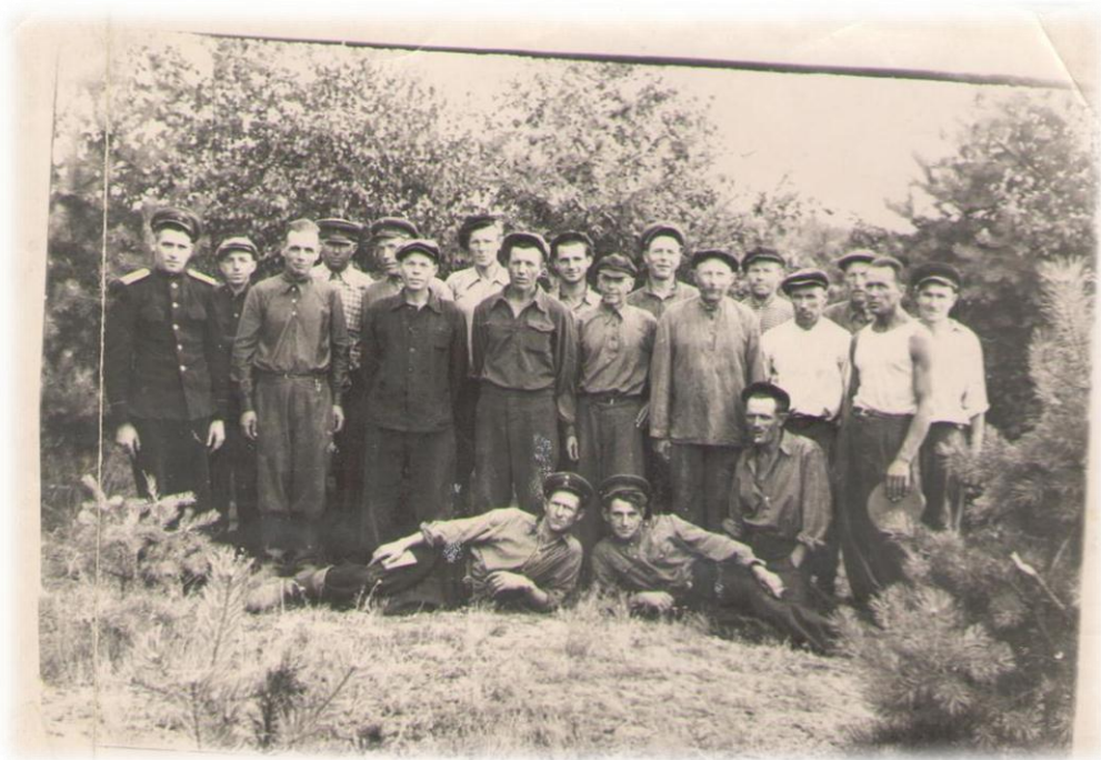
Фото 3. Работники железной дороги в г. Вилейка.